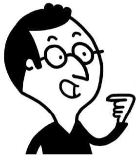
consommateurs et consommatrices