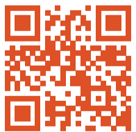
consommateurs et consommatrices