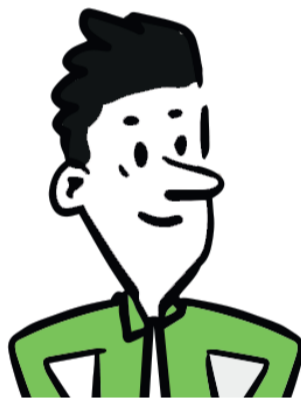
Entrepreneurs et entrepreneuses de l'agro-alimentaire