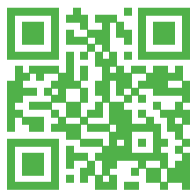
Entrepreneurs et entrepreneuses de l'agro-alimentaire

DÉCOUVREZ ET PARTAGEZ NOS VIDÉOS SUR LES GESTES À METTRE EN PLACE POUR RÉDUIRE LES DÉCHETS ALIMENTAIRES