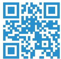
Restaurateurs et restauratrices

Professionnel.le.s devenez membre du REGAL! en signant la charte d'engagement réciproque sur le site internet du REGAL!